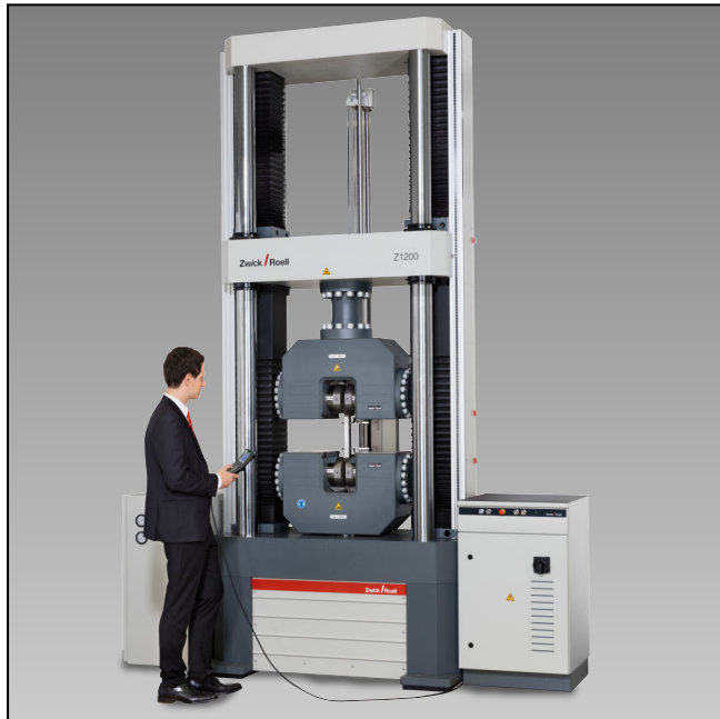
Z1200E mit Hydraulik-Probenhalter